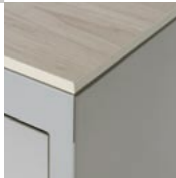
Encimera Taulell Worktop Dessus