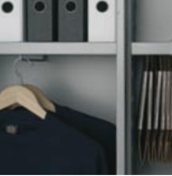
Separación central Separació central Central divider Séparation centrale