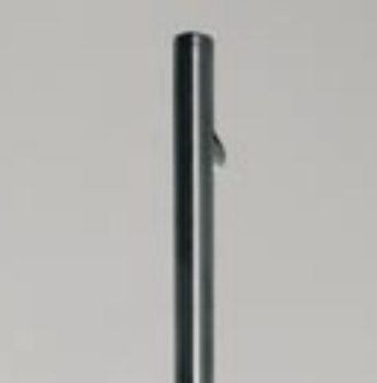
Tirador en asa inox. Tirador amb nansa inox Stainless pull handle Tirette en anse inox.