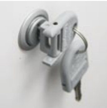
Llave articulada Clau articulada Articulated key Clé articulée