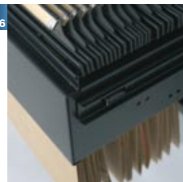
Bastidor extensible con antivuelco incluido Bastidor extensible amb anti-volcatge inclòs Extendable frame including non-capsizing Châssis extensible avec anti-retournement inclus