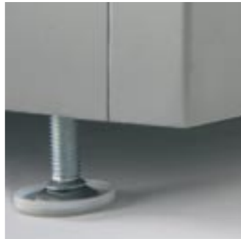
Tirador en asa ABS Tirador amb nansa ABS ABS pull handle Tirette encastrée en anse ABS