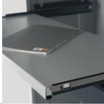
Estante extensible Prestatge extensible Extendable shelf Rayon extensible